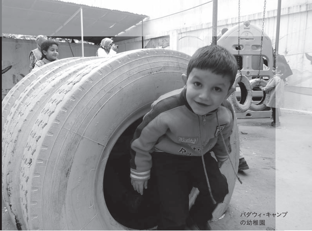
バダウィ・キャンプ の幼稚園

シリア内戦が勃発して3年になります。出口の見えない紛争は混迷を極め、戦火を逃れて国境を超える避難民の数は240万人。増加の一途をたどっています。「パレスチナ子どものキャンペーン」の支援拠点のあるレバノンには、UNHCR（国連難民高等弁務官事務所）によると、2014年2月現在、隣国シリアから90万人以上の避難民が流入しているといえます。この数は、レバノンの人口の20パーセント以上におよび、急激な人口増加と住居・食糧不足、物価上昇という形で隣国にもシリア内戦の影響が及んでいます。そして避難民の1割以上がこれまでシリアに住んでいたパレスチナ難民です。