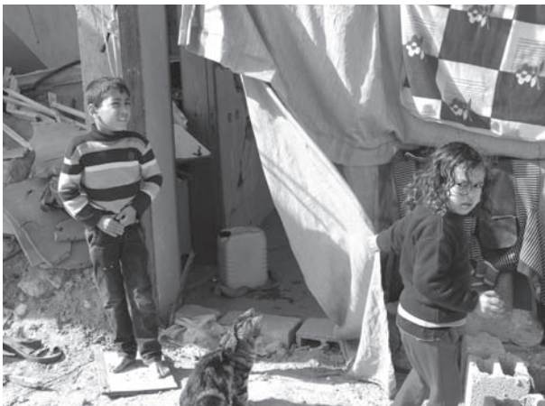
表情を変えない子どもたち 父親は「子ども達は、人を怖がるようになってしまった」と話す