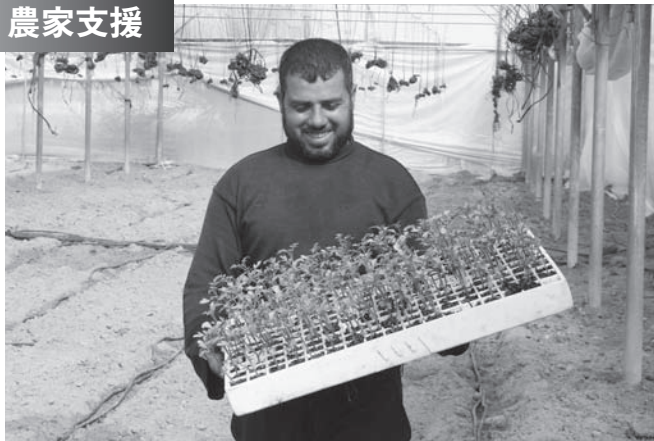
配布されたトマトの苗の作付を始める農家