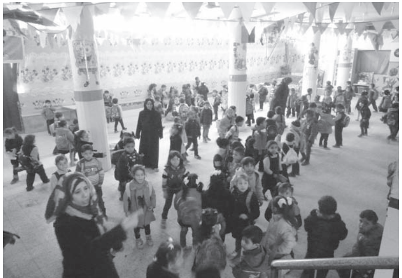
壁のように見えるのは破壊されたところにシートを張っているだけ