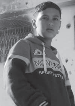
シジャイヤ地区。壁一面の弾痕。部屋の中は焼け焦げ、1階には戦車が突っ込んで大きな穴が開いている

8月26日の停戦から半年。ガザでは復興どころか瓦礫の撤去すら進んでいません。復興資金が集まらない上に、封鎖のため建築資材が手に入らず、10万人がいまも学校、知人宅、モスクなどでの避難生活を余儀なくされています。毎週のように市民の抗議デモが起き、国連の施設前でも座り込みが続いています。大人も子どもも閉塞感とストレスを抱えながら、例年になく荒れ模様の冬を耐え忍んできました。先行きに希望を見出せない人々がガザから脱出しようとして発砲されたり捕まったり、これまでなかった若者の自殺事件も多く報じられるようになりました。当会では緊急支援活動を今年も継続します。