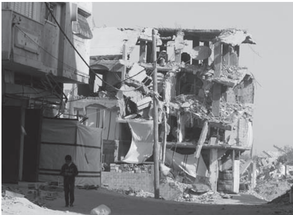
崩れ落ちそうな建物にも人々は戻っている