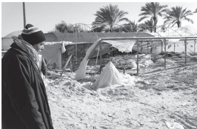
破壊されたビニールハウス

ガザでは軍事侵攻によって3450ヘクタールの農地、202の井戸、55の給水塔、325の貯水池などが破壊されました。また畑に行けなかったために枯れた作物や、死んだ家畜の損失も併せると農家が受けた被害は甚大で、19400戸の農家が生産活動に復帰できないままです。