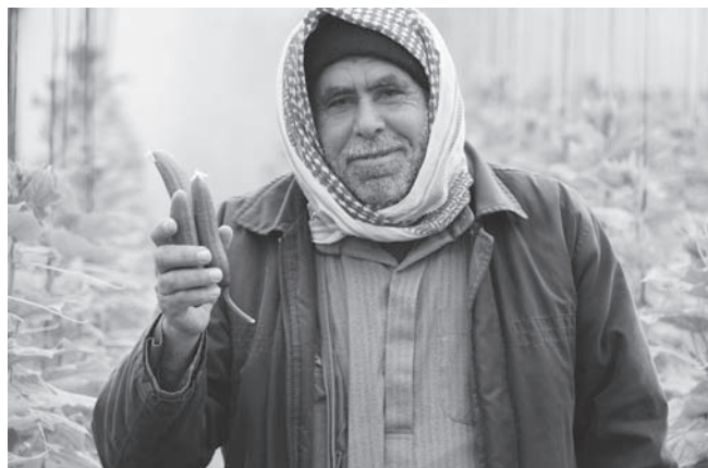
今季最初のキュウリの収穫

シジャイヤ地区では侵攻により数百人の子どもが負傷しました。応急手当は受けたものの、その後の医療支援を受けられずにいるため、傷が悪化したり、障がいが残ったりしている子どもが多いので、4月から医療チームによる訪問支援を開始します。