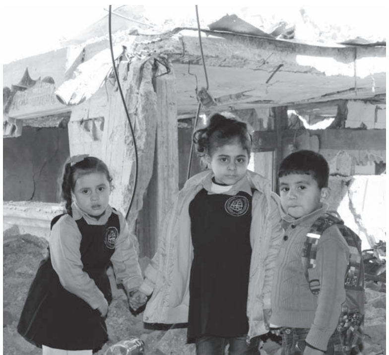
バッシール幼稚園の子どもたち