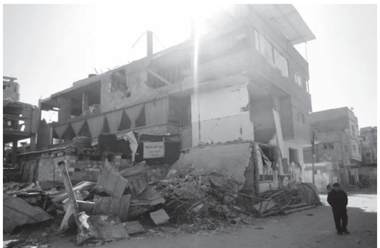
3階は使えないため1階と2階でなんとか幼稚園を続けている