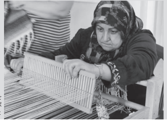
各センターではラグ織り講習をして母親たちを心理面でもサポート。日本人スタッフが紹介した

族が国境を超えトルコやリビアから欧州へ海を渡ります。「より良い未来」を手にするための命を懸けた難民たちの決断です。定員をはるかに超える人々が乗った小舟が、イタリアを目の前に沈没してしまったなど悲惨な結末に至ることは少なくありません。ある家族は全員でエジプトに行き、そこからイタリアへと渡る予定でした。しかし、エジプトで地中海の海原を目前にして、怖くなってレバノンに引き返してきたといいます。そのときその場所で、どちらに向かうかあるいは留まるか、生命を左右する決断に迫られ続ける難民の生活。