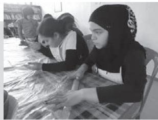
学校に行っていない10代の少女たちを集めて料理や文化を教える活動も