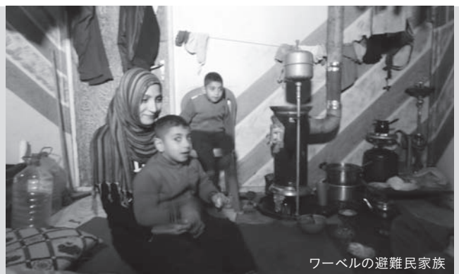
ワーベルの避難民家族

「今日は、〇〇ちゃん一家が無事フランスに到着した」、「〇〇くん一家はリビアで（イタリア行の）船を待っているそう」という海外移住の話をよく耳にし、元からの住民さえ口をそろえて「ここには未来がない」といいます。シリア内戦はすでに4年目に入り、今のシリアの状況を前に「帰還は難しいのでは……」と絶望的に考え出している人は少なくありません。支援がいつまで続くか分からないため、多くのシリア難民家