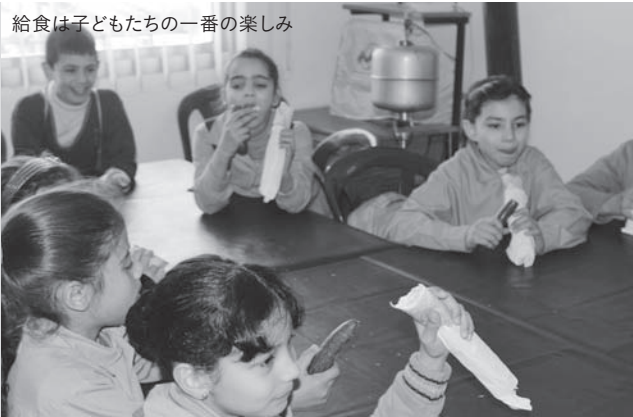
給食は子どもたちの一番の楽しみ